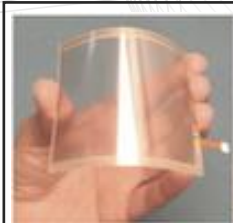
世界級化工新穎材料