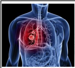
前瞻生技醫療技術